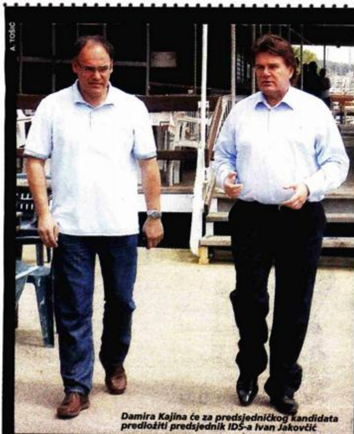
Damira Kajina će za predsjedničkog kandidata predložiti predsjednik IDS-a Ivan Jakovčić

Istarski su birači Mesiću 2000. godine dali 61,65 posto glasova, a pet godina kasnije prošao je još bolje - u prvom je krugu dobio 77,25 posto, a u drugom gotovo nevjerojatnih 89,15 posto glasova. Zanimljivo je da je 2000. godine Mesić u Istri ostvario najbolji rezultat u Balama, 72,96 posto (nedavno je postao i njihov počasni građanin), dok mu je 2005. rekord bio u Sv. Nedelji - 86,46 posto.