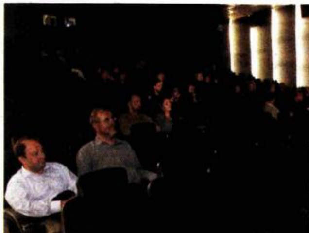
Svake srijede u 20 sati Zadrani će moći vidjeti jedan dosad neprikatani filmski naslov